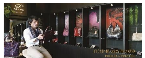
本社ショールーム