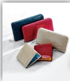
ヘンロン社製の革を使った クロコダイル財布のオーダー