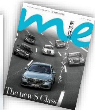
メルセデスマガジンme等にも 掲載されております